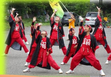
元気いっぱい よさこいソーランの演

地域の皆様、山の手高校の皆様、歌や踊りをご披露いただいた各団体の皆様、ご協力に心より感謝申し上げます!